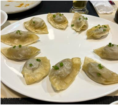
蒸し餃子？（特別注文）

今回、オーダーしたのはビールに、水餃子、スンドゥブチゲ、プルコギ、イカ炒め、ビビンバの5品です。パンチャン（前菜）が7品出てきました。料理が出てくるまでに時間がかかったのでパンチャンとビールで話もはずみ、つついビールがすすみました。オーダーした料理の中で、特にお勧めはイカ炒めです。ピリ辛で甘辛く炒めたイカと野菜はビールに最高です。オーダーした水餃子がなく、代わりに水餃子風に作れるということで出てきたのは蒸されて熱で皮が乾燥して硬くなってしまった餃子（蒸し餃子？）が残念でした。それ以外の料理はおいしく、韓国料理を満喫できました。個室のため、とても静かで韓国ドラマや映画について会話が弾みました。